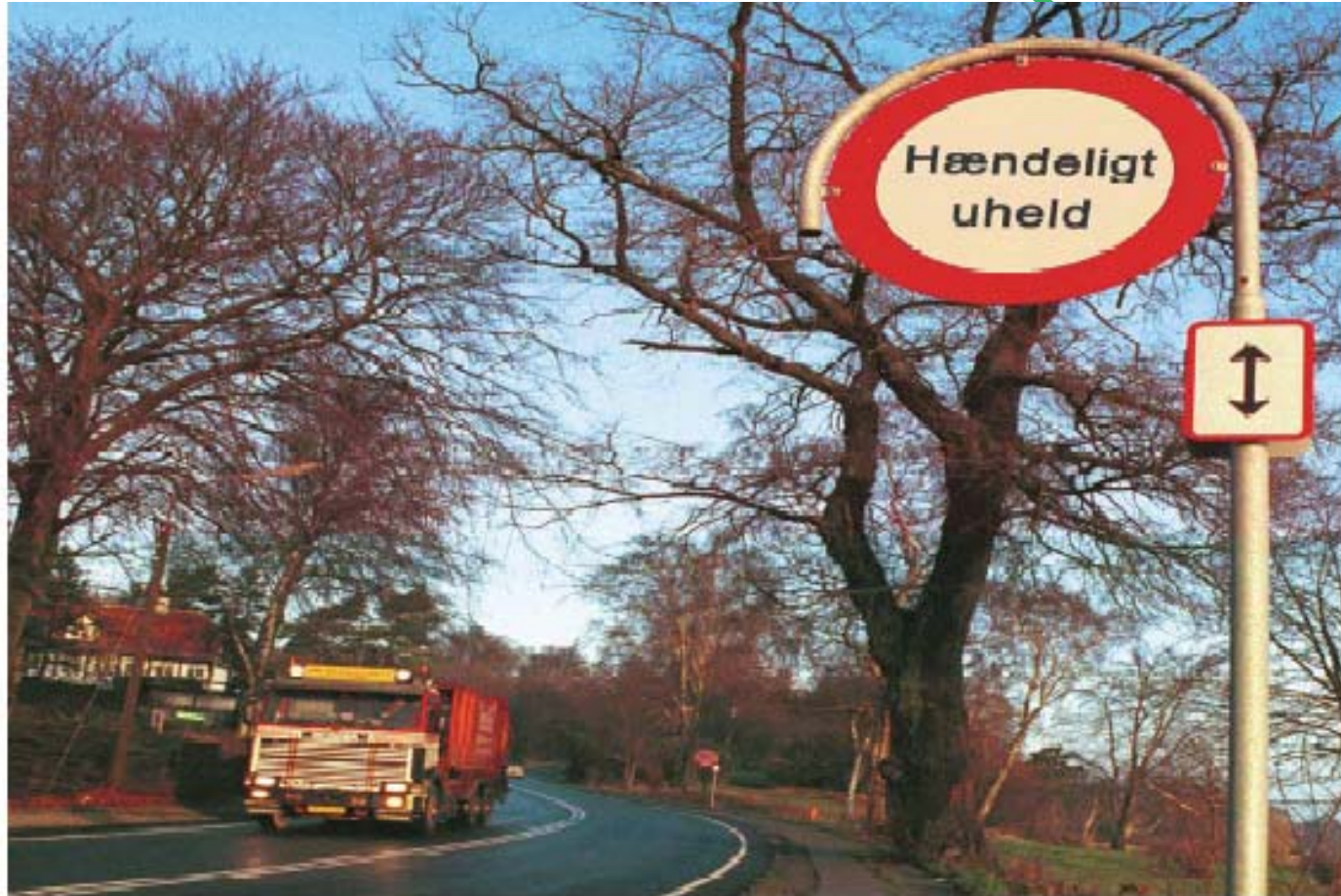
Foto: Forebyg arbejdsulykker – to værktøjer til den grafiske branche

Ulykkesforebyggelse på små virksomheder gennem arbejdsmiljøledelse. COWI, Marchen Petersen og Henrik Bonnesen, den 17.aug.2004