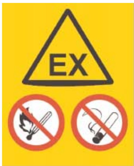
Skilt 2: Eksempel på ATEX-skilt med forbud mod rygning og åben ild