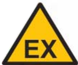
Skilt 1: Eksempel på almindeligt ATEX-skilt

EX-skilt kan også anbringes på produktionsanlæg, f.eks. på det sted, hvor man normalt skal lave indgreb på maskinen, for at vise, at man skal være specielt opmærksom her.