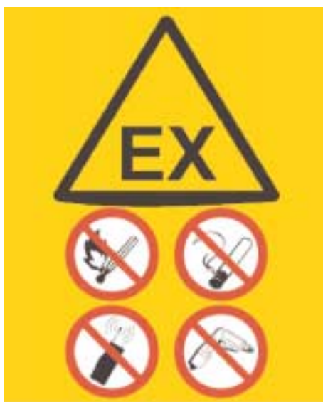
Skilt 3: Eksempel på ATEX-skilt med forbud mod rygning, brug af åben ild, mobiltelefoner og elektrisk værktøj