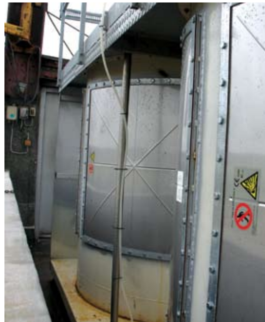
Eksplosionsaflastninger på fx filteranlæg eller siloer skal føres ud i det fri. Billedet viser eksplosionsaflastninger udendørs på toppen af to siloer.

Hvis man skal installere nyt materiel og elektrisk udstyr indenfor den eksplosionsfarlige zone, så skal det være EX-mærket. Det betyder, at udstyret (fx lysarmaturer, el-motorer og pumper) ikke virker som tændkilde, fx ved at afgive gnister eller ved at blive meget varmt på overfladen.