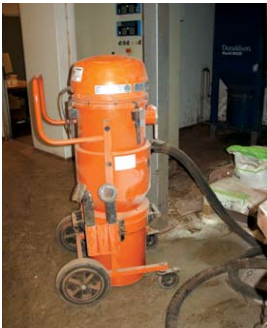
Store industri-støvsugere, der bruges til at fjerne fint brændbart støv som fx fiskemel, kan danne eksplosiv atmosfære inde i støvsugeren.