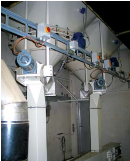
Rummet under siloerne er pænt rent, og der er ingen åben transport af blodmelet. Fra siloerne snegles blodmelet ned i en redlertransportør (nederst i billedet). De lodrette skakte er zoneklassificerede zone 20, mens redlertransportsystemet er klassificeret zone 21.