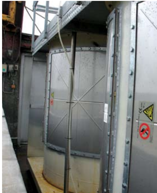
Sprængplader på de to siloer er placeret i fri luft på toppen af siloerne.