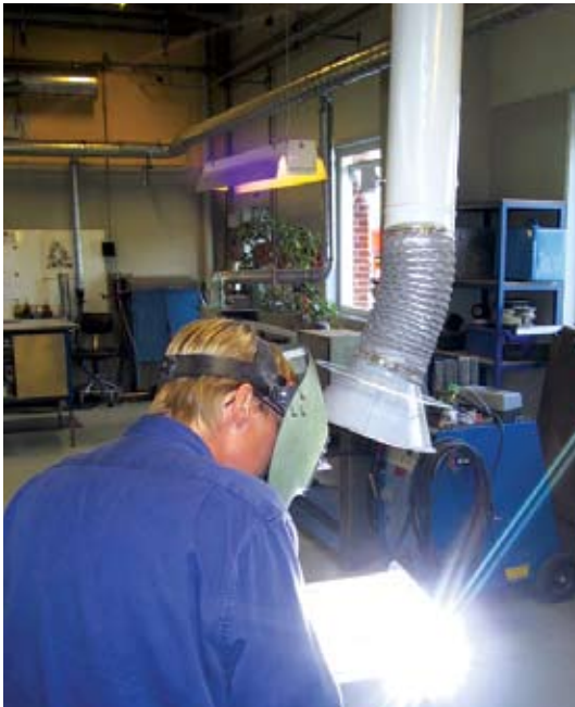
Svejsning i zoneklassificeret område eller udenpå en silo kan føre til eksplosion.