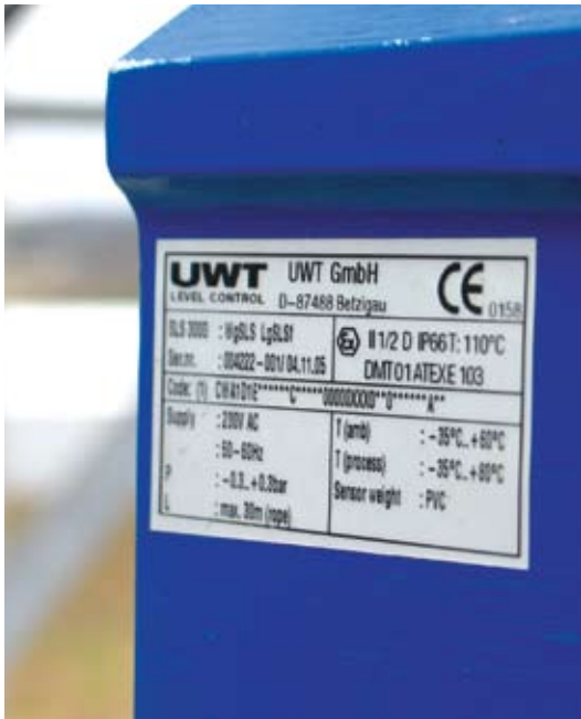
EX-mærket niveaumåler til silo. Niveaumåleren er godkendt til at operere i zone 20 (materialkategori 1D).