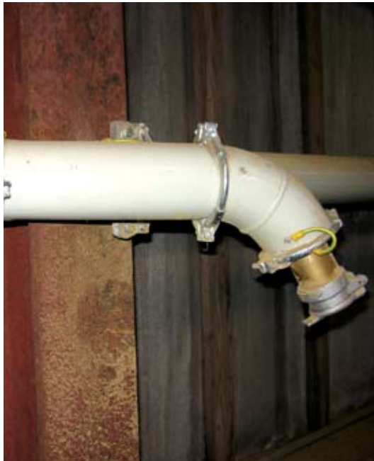
Potentialudlignede og jordforbundne dele af et centralt støvsugeranlæg er en helt nødvendig foranstaltning for at undgå statisk elektricitet.